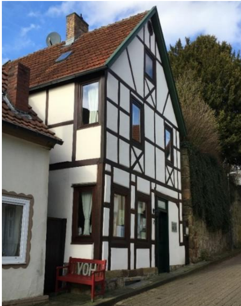
... unser Heimathaus, das „Haus der Iburger Geschichte“