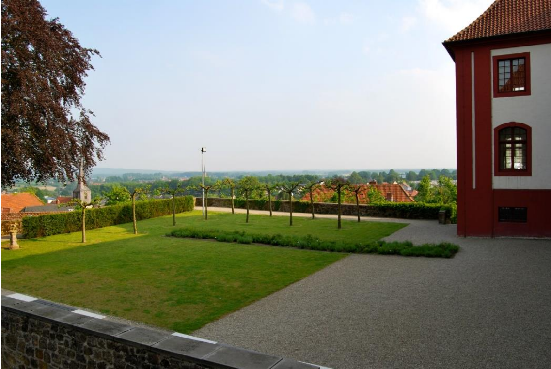
Ein Blick vom ehemaligen Konventgarten bis ins ferne Münsterland

Wir danken der Touristinformation (T) der Stadt Bad Iburg für die Abdruckgenehmigung der Fotos