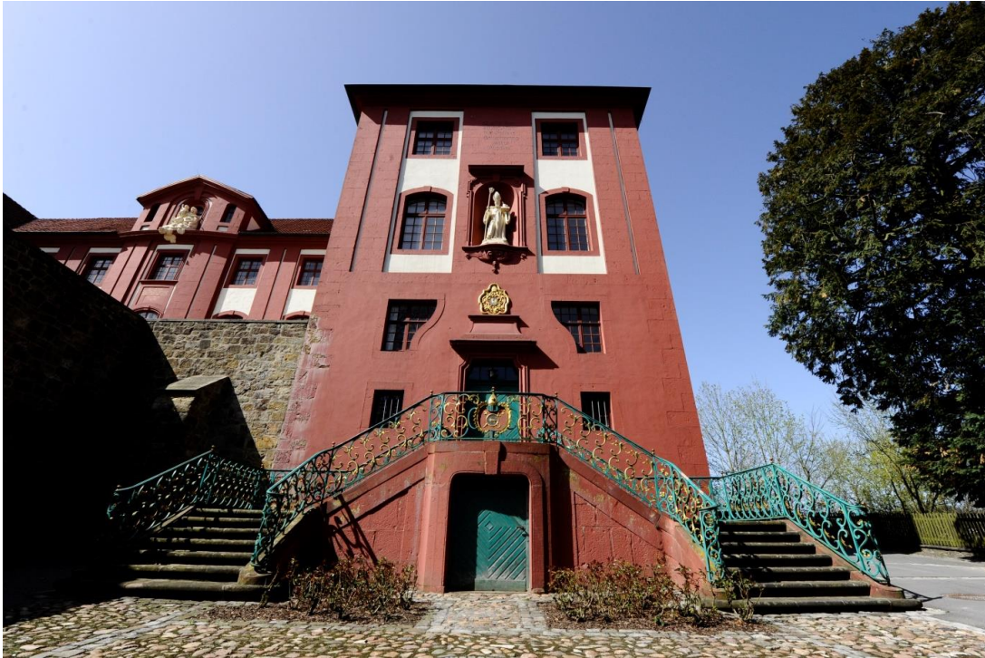
Das ehemalige Iburger Benediktinerkloster