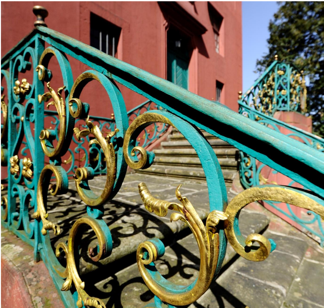
Die historische Außentrappenanlage