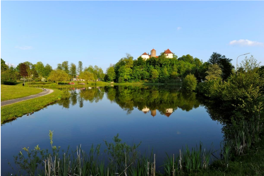
Schloss Iburg mit dem Charlottensee