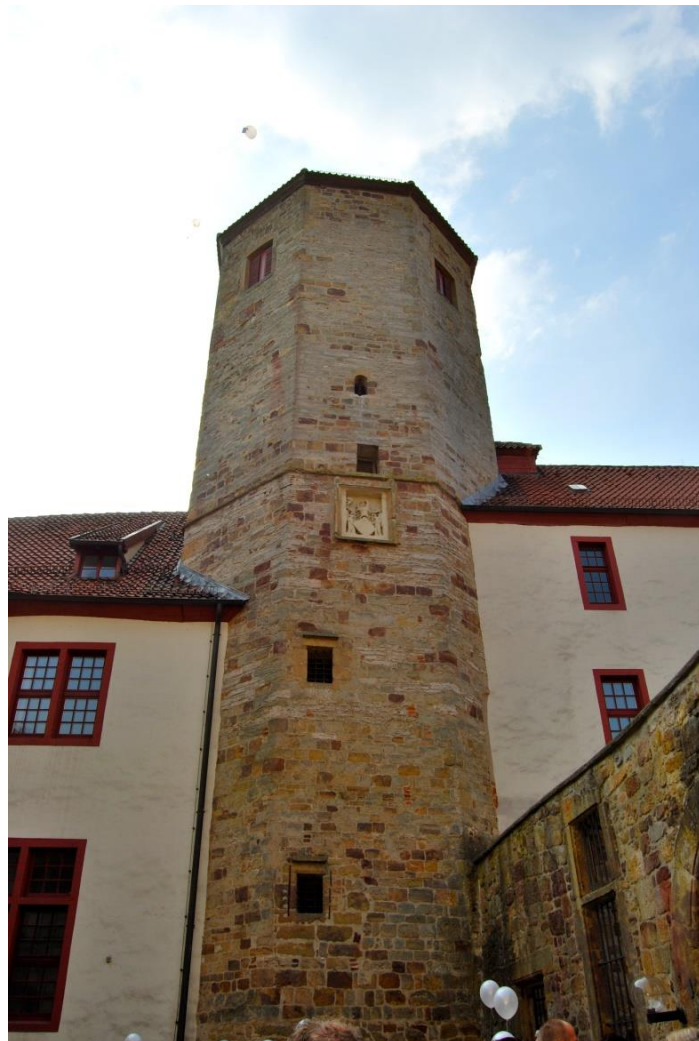
Die ehemalige fürstbischöflichen Residenz mit dem Bergfried „Bennoturm“