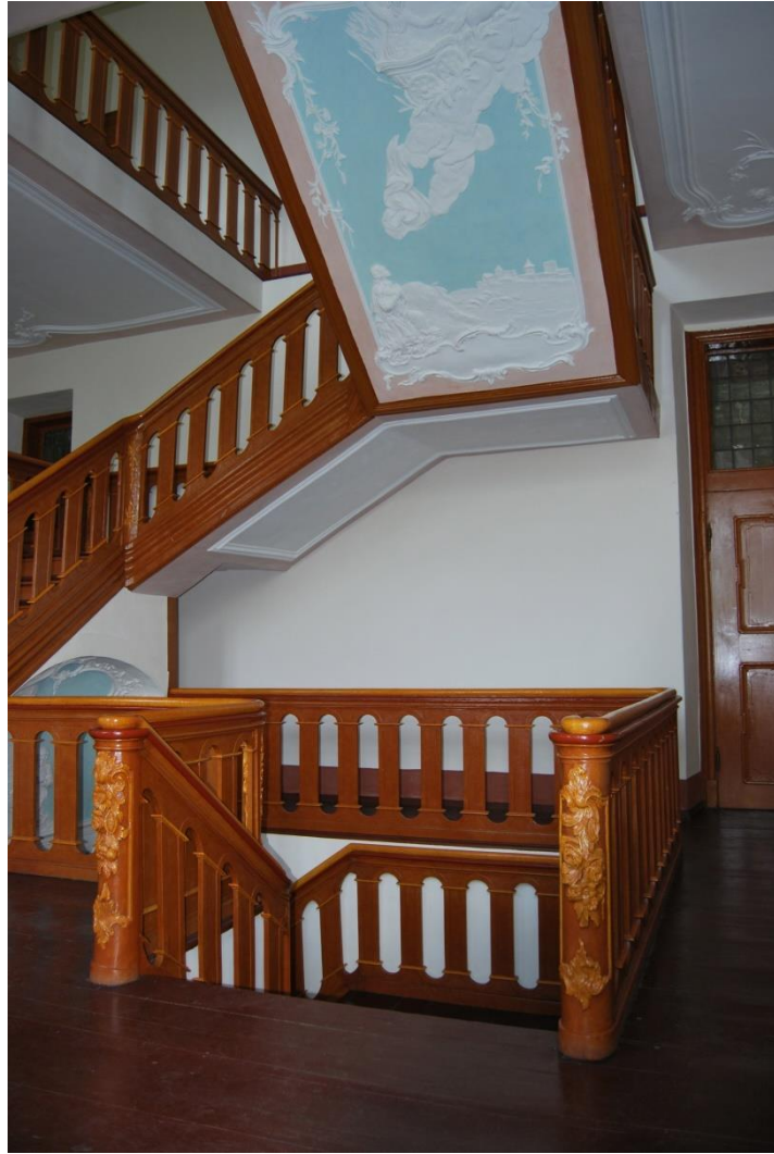
Das historische Treppenhaus im Kloster