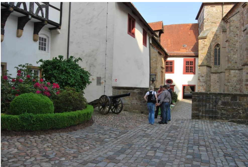
Innenhof mit alten Klostergebäuden