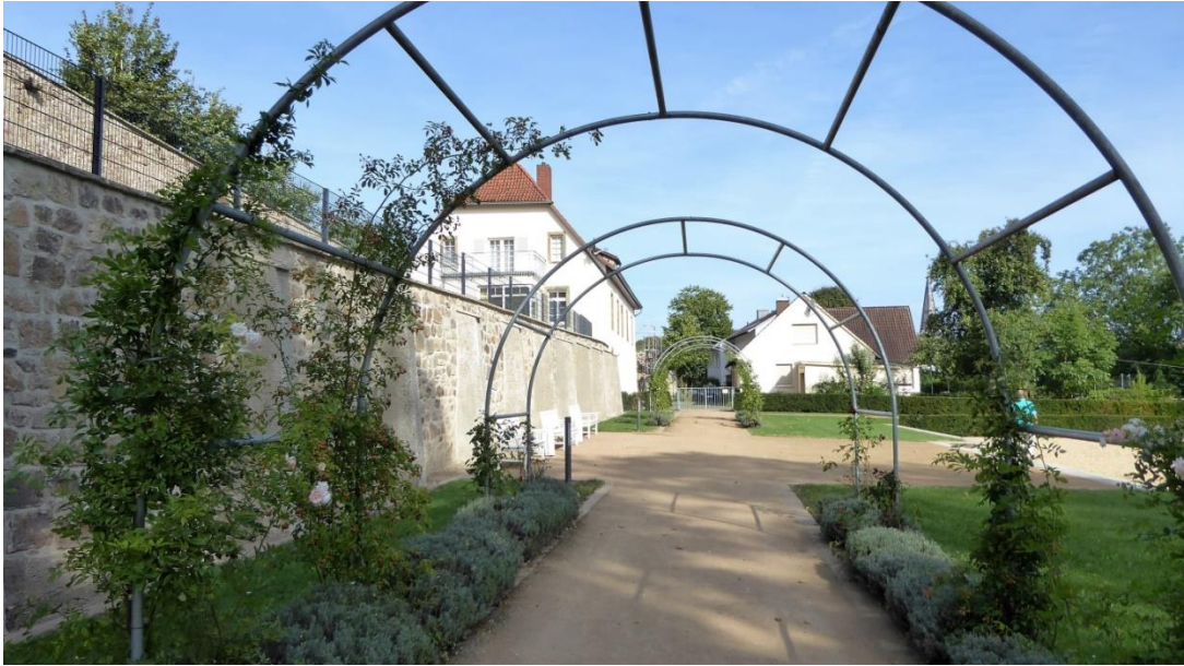
Der Laubenweg im Knotengarten