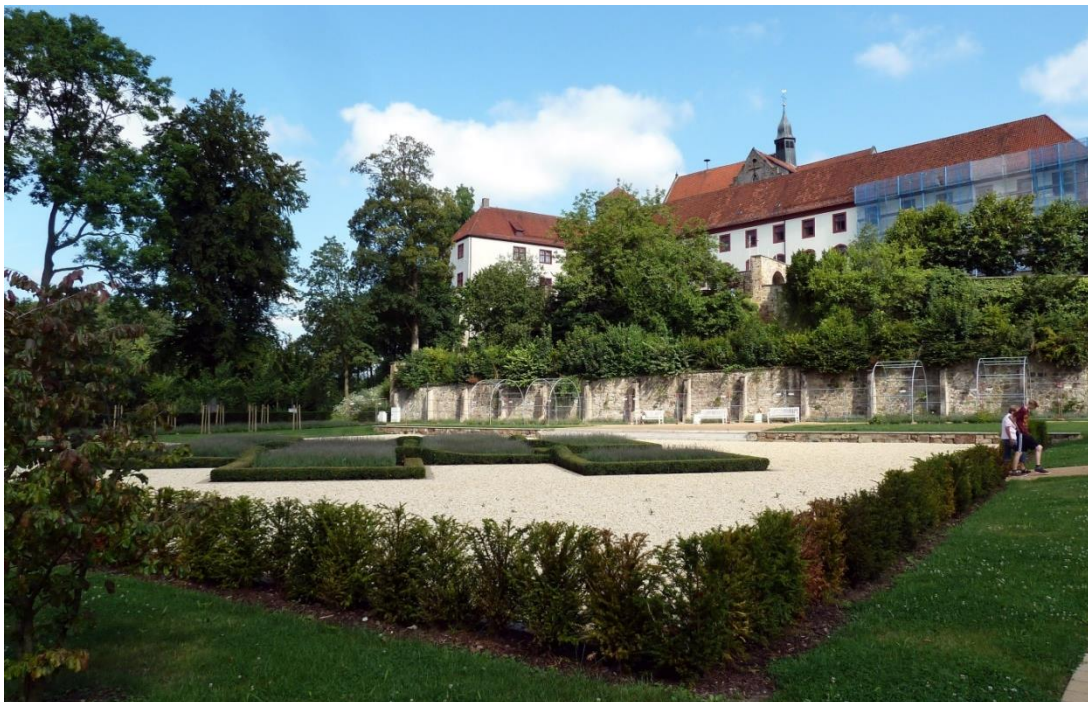
Das Schloss mit dem neu gestalteten Knotengarten